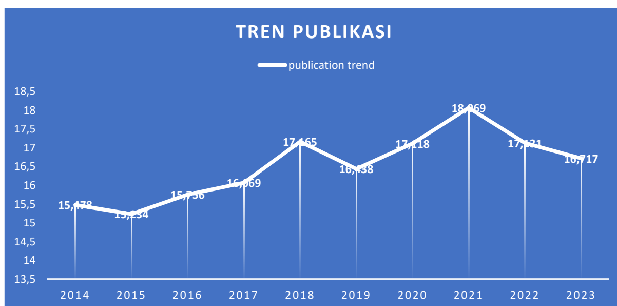
Gambar 2. Tren Publikasi

Data di atas menunjukkan bahwa penelitian tentang Christian Mission mengalami turun naik setiap tahunnya dimana ada sedikit penurunan pada tahun 2014 hingga 2015, namun